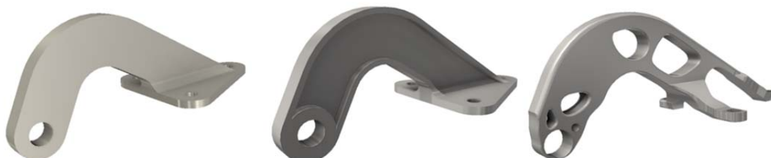
左から基本設計、通常の軽量化、シェイプジェネレーターによる軽量化の例

近年の製造業界では、魅力的な製品を市場投入するために、外観デザイン、環境性能、軽量化などの取り組みに対して多くの関係者がさまざまなアイデアを検討しながら共同作業を行っています。今回の新バージョンでは、こうした環境下で関係者が製品情報を効率的に作りこめるように、ワークフローと連携させた高度な設計機能、他の設計アプリケーションとのデータ相互運用性向上、他の関係者とのコミュニケーション向上などに関する機能強化を行いました。