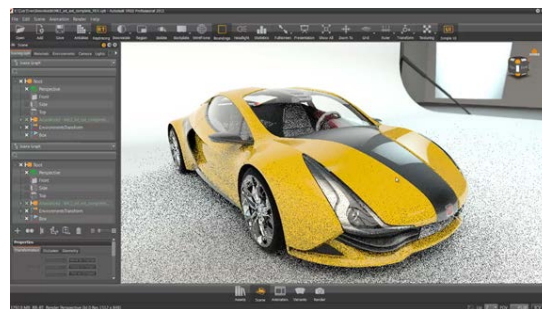
Autodesk VRED ユーザ インターフェースの例